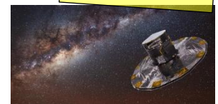
Künstlerische Darstellung der Gaia-Sonde vor dem Milchstraße