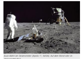
Buzz Aldrin am Stromanometer (Apollo 11, NASA). Auf dem Mond oder im Hologramm?