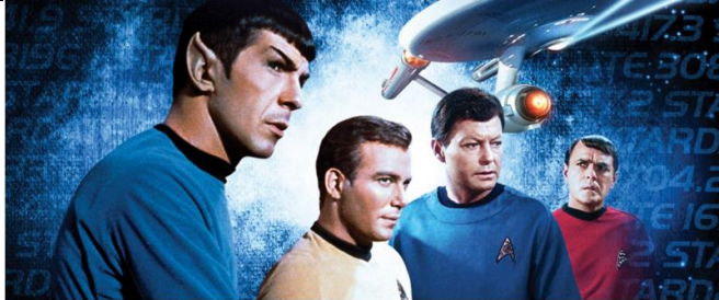
Die Raumschiff Enterprise Originalserie von 1966 wurde in Deutschland ab 1972 gesendet ( www.tele5.de/scifi ; NBC/Paramount). Auch aktuell gibt es noch neue Star Trek Kinofilme.