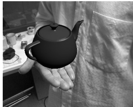
(b) erweitertes Bild

Abbildung 1.1 Beispiel für Bilder, mit Beschreibung. Für nicht selbst erstellte Bilder, die nicht Public Domain sind, ist eine Quellenangabe erforderlich. Bilder aus [Sch01]